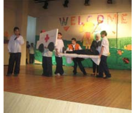
عرض مسرحي عن التطوع

خصص فريق المدربين حصة التربية المدنية لشرح مفهوم التطوع وأهدافه وحقوق المتطوع وواجباته لطلاب الصفين الأساسيين الخامس والسادس. ثم قام هؤلاء الطلاب بالتعبير عن رؤيتهم للتطوع بواسطة أعمال كتابية وفنية. كما أجروا مقابلات مع بعض المتطوعين بهدف التعرف على تجربتهم والاستفادة من خبرتهم. وتوج هذا العمل بإنشاء نادٍ للتطوع يضمّ عشرين طالباً. وأولى نشاطات هذا النادي كانت عرض مسرحية عن التطوع دعي إلى حضورها طلاب الحلقة الثانية وأفراد الهيئة التعليمية ورؤساء الأقسام. كما سيقوم أعضاء النادي لاحقاً بتقديم خدمات تطوعية داخل الجمعية كتنظيف الحديقة وتنظيم أنشطة ترفيهية للأطفال ذوي الاحتياجات الإضافية، ليكونوا بعد ذلك مستعدين لتقديم خدماتهم التطوعية خارج الجمعية.