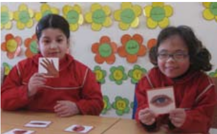
أثناء درس الحواس الخمس