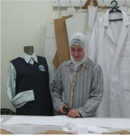
عاملة في معمل الخياطة

لقسم الخياطة في جمعية رعاية اليتيم ثلاثة أهداف: التعليم والتدريب والإنتاج. فالمعمل يستقبل طالبات يتلقين التدريب المهني المعجل لسنة واحدة، ليحصلن بعدها على شهادة من المؤسسة الوطنية للاستخدام- دائرة الرعاية المهنية، تخولهن الانخراط في سوق العمل لاحقاً. ولترسيخ المعلومات والمهارات التي يكتسبونها، من تفصيل وباترون وخياطة وتريكو وأرتيزانا يتدربن مدة ثلاثة أشهر في المعمل بعد التخرّج. والمعمل يحوي ٣٠ آلة خياطة متعددة الوظائف، وخمس آلات تطريز و٤ آلات تريكو ومكويين على البخار. مع هذه التجهيزات المتنوعة استطاع المعمل تأمين كامل الاحتياجات للمؤسسة كالزبي المدرسي الكامل والألبسة الرياضية وملابس النوم والبياضات من مناشف وشراشف وثياب داخلية وأزياء للحفلات والمناسبات والكنزات الصوفية والشالات والقبعات وثياب العاملين في جميع الأقسام. إنّ هدف هذا المعمل هو الاكتفاء الذاتي. وفي المستقبل يمكن لمعمل الخياطة بالإمكانات التي يملكها أن يوسّع دائرة عمله ويقدم إنتاجاً للسوق، وبذلك يستطيع أيضاً أن يضمن فرص عمل للفتيات بعد التخرّج.