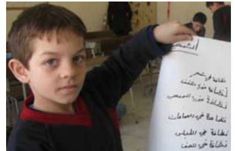
خلال التوعية على النظافة

بدأ قسم الخدمات الاجتماعية في جمعية رعاية اليتيم في صيدا برنامج التوعية الذي يتوجّه إلى الطلاب في المدرسة الابتدائية وقسم ذوي الاحتياجات الإضافية ومدرسة تأهيل وتوجيه الصم والقسم الداخلي. ويتضمن هذا البرنامج عدة مواضيع تصبّ في خانة احتياجات الطلاب، أهمها: ميثاق المجموعة، النظافة الشخصية، حقوق الطفل، التربية الجنسية، الصداقة، الغذاء السليم، تقييم الذات، البيئة. واللافت في هذا العمل مدى تجاوب الطلاب وحماهم الذي تجسد بنقل المعلومات بين بعضهم البعض عملاً بمبدأ «من طفل إلى طفل» خصوصاً بين تلامذة المدرسة الابتدائية. ويتم تحفيز الطلاب من أجل الالتزام بما يكتسبونه وتطبيقه للمحافظة على فعالية البرنامج.